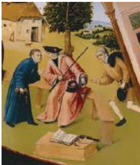
Фрагмент «Алчность» картины Иеронима Босха «Семь смертных грехов»

Рассматривая участников коррупции на примере взяточничества, стоит отметить, что в коррупционном процессе всегда участвуют две стороны. Одна сторона — это взяткополучатель (подкупаемый). Вторая сторона — это взяткодатель (осуществляющий подкуп). Также в процессе может участвовать и третья сторона — посредник.