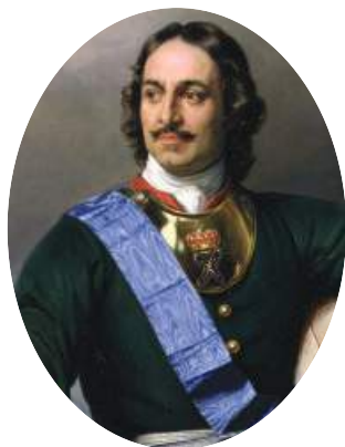
Император Петр I

Сообщениями «о похищении казны» первоначально занималась тайная канцелярия во главе с графом П.А. Толстым. И работала она на совесть. Но были и такие дворяне и чиновники, которые к проблеме мздоимства относились гораздо терпимее. По рассказам современников, однажды в Сенате Петр пригрозил издать указ, по которому всякий, кто украдет у казны сумму, на которую можно купить веревку, будет повешен. Генерал-прокурор Ягужинский на это заметил: «Неужели вы хотите остаться императором без служителей и подданных? Мы все воруют — с тем только различием, что один больше и приметнее, чем другой».