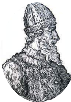
Великий князь Иван III

До XVIII века чиновники на Руси жили благодаря так называемым «кормлениям», то есть, при отсутствии оклада за исправление должности, разрешению на подношения от заинтересованных в их деятельности лиц. Одаривали их не только деньгами, но и «натурой» — мясом, рыбой, пирогами и пр., что было делом обыкновенным.