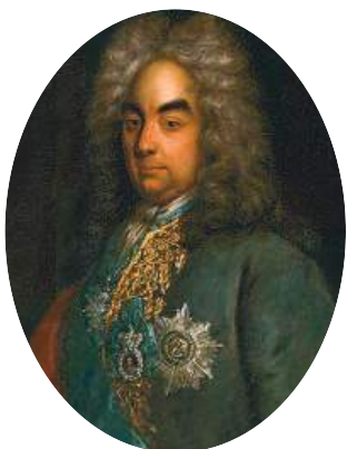
Петр Андреевич Толстой