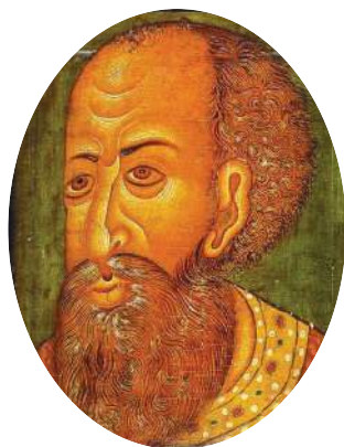
Царь Иван IV Грозный