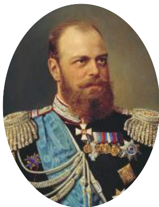
Император Александр III